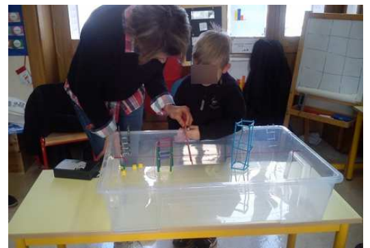
Quand les maîtres-nageurs se déplacent dans les classes...